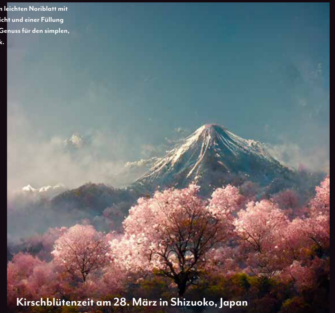
Kirschblütenzeit am 28. März in Shizuoko, Japan

Ummantelt von einem leichten Noriblatt mit einer dünnen Reisschicht und einer Füllung nach Wahl ist sie ein Genuss für den simplen, schlichten Geschmack.